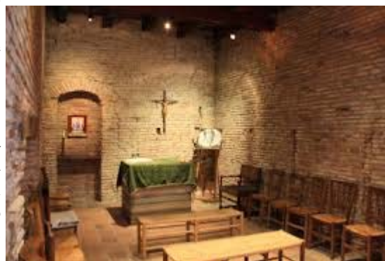
El primero dormitorio de frailes predicadores –Tolosa

En Enero de 1215 sin embargo, las circunstancias cambiaron. Domingo recibió como regalo una propiedad en Toulouse, que representó otra posibilidad para el establecimiento de una comunidad de predicadores. El donante fue Pierre Seilhan, bien conocido por nosotros por la aun superviviente Casa Pierre Seilhan en la plaza del Parlamento de Tolosa. La transferencia de la propiedad se completó el 25 de Abril de 1215, cuando la herencia de Seilhan fué otorgada y la propiedad compartida entre los dos hermanos. En Mayo, el Obispo Foulque formalizó el acuerdo, convirtiendo la comunidad de Domingo en una institución diocesana permanente.