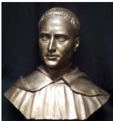
Busto del P. Henri Dominique Lacordaire op, obra del artista Jean-Marie Bonnassieux (1810-1892)

Sin embargo, para coleccionistas de Dominicana , se pueden encontrar interesantes hallazgos. La asociación S.H.O.P. ha adquirido recientemente un breviario dominico para Semana Santa del 171, el cual claramente pertenecía al convento de Saint-Jacques en Paris antes de la Revolución Francesa, y un busto de bronce de Fray Lacordaire por solo 50 euros ¡ Tambien por 12 euros un conjunto de cuatro acuarelas, sobre la vida conventual en Ficherfont, Belgica, de la mano de ‘Sor Sonrisa’, la entonces famosa “monja cantante”, quien de hecho enseñaba en la Academia de Bellas Artes de Bruselas antes de convertirse en dominica. Tales artículos pueden tener más valor sentimental que otra cosa, pero al menos uno siente que es darles un buen destino.