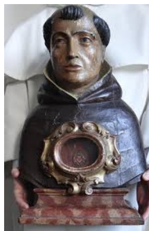
Reliquiario del siglo XVIII con reliquia de santo Domingo de la casa de santo Domingo, Fanjeaux.

Para los afortunados que puedan visitar Tolosa durante las tres semanas desde el 5 al 30 de Mayo, (muy justo ya!) en que esta exposición permanecerá en la Universidad Católica de Tolosa, esta es una oportunidad única para ver algunos tesoros de la iconografía dominica que no son normalmente accesibles para el público en general. Las obras de arte que integran esta exposición provienen de muchos conventos dominicos de toda Francia.