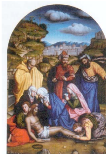
Lamentación por Sor Plautilla

Ann ROBERTS, Dominican Women and Renaissance Art , Ashgate, 2008