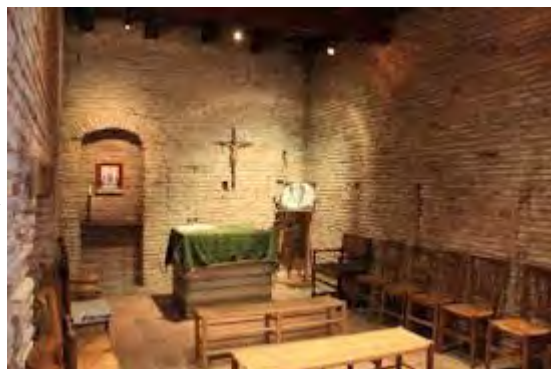
Probablement le premier dortoir de frères prêcheurs, Maison Pierre Seilhan, Toulouse