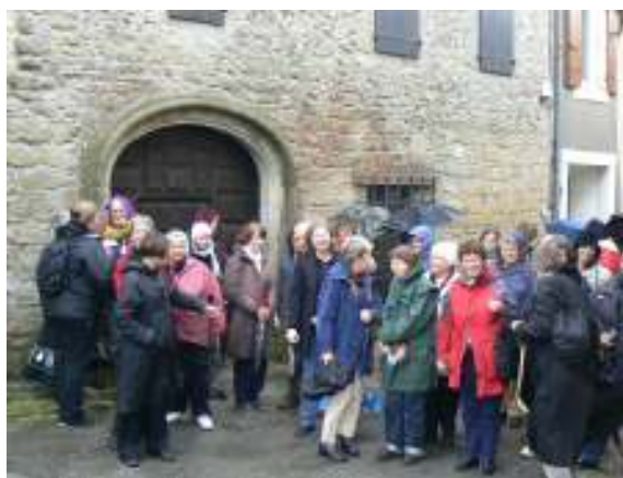
Un groupe de pèlerins attend la visite devant la Maison de Saint Dominique à Fanjeaux >