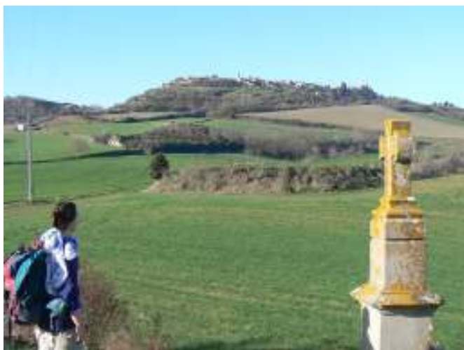
< Une touriste découvre Fanjeaux à l'horizon, depuis un chemin de randonnée balisé.

Quel que soit le projet - montage de visites pour les groupes, chemin de Saint-Jacques de Compostelle, création de document touristique, sentiers de randonnée - le maître mot est « concertation ». Même si le chemin à parcourir est encore long, les projets touristiques prennent forme, nul doute qu'ils aboutiront!