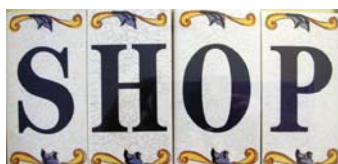
> La nouvelle maison de S.H.O.P. à Fanjeaux - la maison est à droite