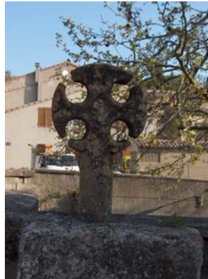
Croix discoïdale du XIIIe siècle à Fanjeaux